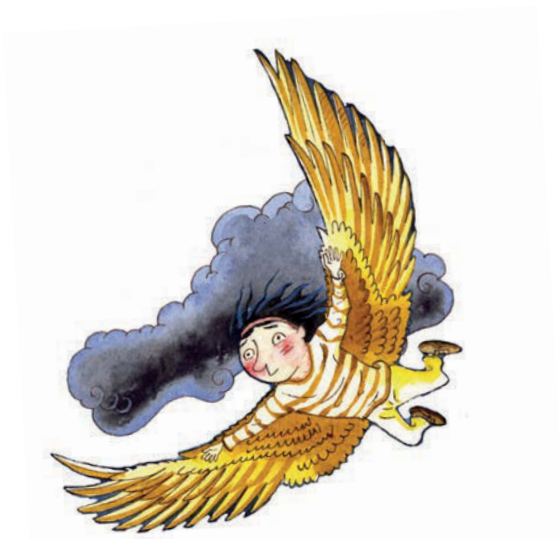
Bild Peter Bay Alexandersen Översättning Carina Gabriellson Edling